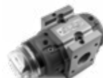
Drehkolbengaszähler MID zugelassen MRM