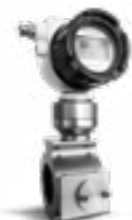
Quantometer elektronisch MQMe