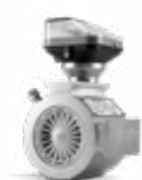
Quantometer mechanisch MQM