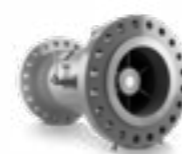
Turbinenradgaszähler MID zugelassen MTM