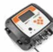
Mengenumwerter HBA zugelassen MECflex