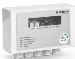
KÜCHENSTEUERUNG KCU 100ADW