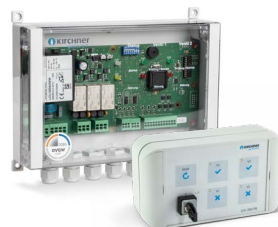
LABORSTEUERUNG LCU 200 ADWM / ADWCL FERNBEDIENUNG FB 200 ADW