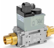
ZENTRALE ABSPERREINRICHTUNG VCC