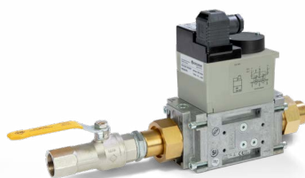
GASABSPERREINRICHTUNG FSA 320