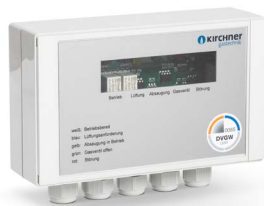
KÜCHENSTEUERUNG KCU 100 ADW