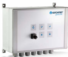
LABORSTEUERUNG LCU 200 ADWC