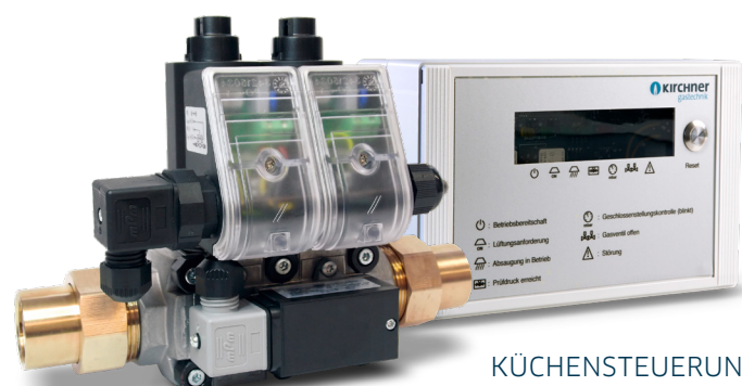
KÜCHENSTEUERUNG KCU PLUS 100ADW