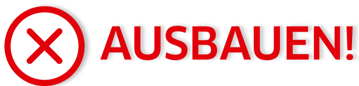
GASABSPERREINRICHTUNG LSV 225V01-T12

Austausch jetzt: Eine sicherheitstechnische Modernisierung ist an diesen Anlagen erforderlich, wenn ein irreparabler Defekt an Schaltung oder Magnetventil auftritt, da beim Austausch eines der Geräte der Bestandsschutz erlischt.