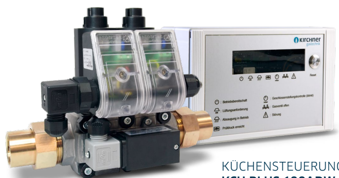
KÜCHENSTEUERUNG KCU PLUS 100ADW