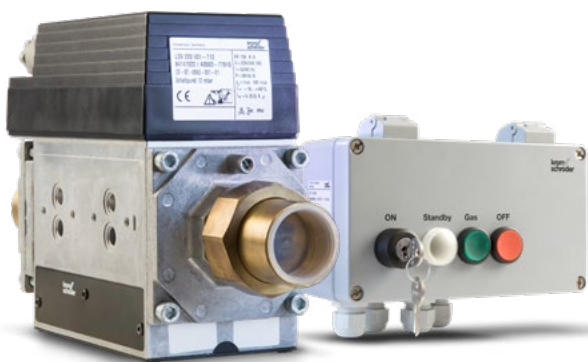
SCHALTKASTEN SK 32