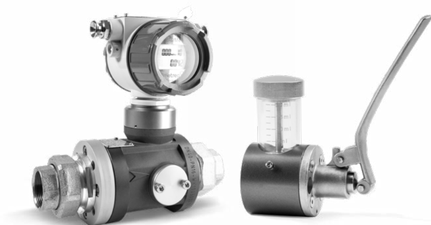
MQMe Quantometer (Rp 1 1/2" Innengewinde)

* =Die absolute Zahl der HF-Impulse ist von der Zählergröße und dem individuellen Zähler abhängig. Die angegebenen Werte sind typische Größen. Die aus der Kalibrierung bestimmten, exakten Werte eines Zählers befinden sich auf dem Typenschild.